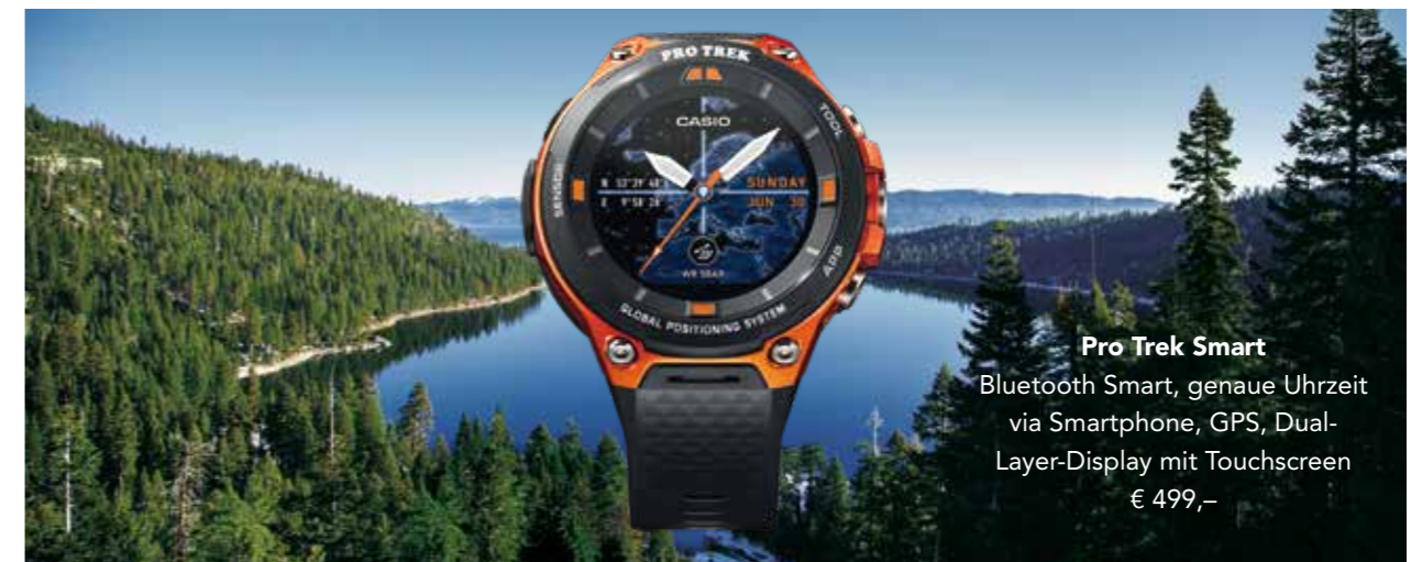
Pro Trek Smart Bluetooth Smart, genaue Uhrzeit via Smartphone, GPS, Dual- Layer-Display mit Touchscreen € 499,-