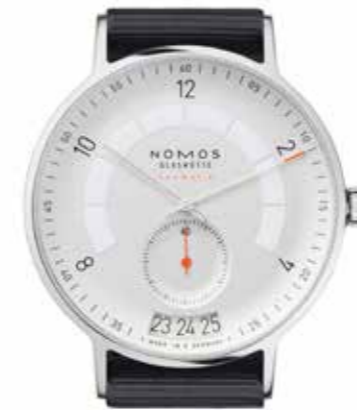
Autobahn neomatik 41 Datum Kaliber DUW 6101, Edelstahl, zweiteilig gewölbter Saphir- boden, Superluminova-Leucht- ring, Textilband € 3.800,-

Update für eine Ikone. Die berühmte Tangente der Manufaktur NOMOS Glashütte wird zu Tangente neomatik 41 Update – automatisch, superflach, hochpräzise und mit einzigartigem Ringdatum: schnell verstellbar, vor und zurück, zwei rote Punkte rahmen den Tag. Dieses und zwei weitere Modelle mit dem neuen neomatik-Kaliber mit Datum finden Sie ab sofort Amstetten bei Juwelier Hochholzer. Mehr: hochholzer.at, nomos-glashuette.com