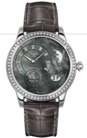
PanoMatic Luna Automatikwerk 90-12, Edelstahl, Gehäuse mit 65 Brillanten, 39,4 mm, Perlmutterzifferblatt mit 18 Brillanten, DS* € 17.400,-