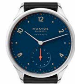
Minimatik nachtblau Kaliber DUW 3001, Edelstahl, 35 mm, dreiteiliger Saphirglasboden, rhodi- nierte Zeiger, Lederband € 3.000,-