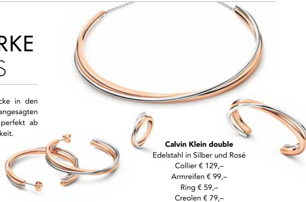
Calvin Klein double Edelstahl in Silber und Rosé Collier € 129,- Armreifen € 99,- Ring € 59,- Creolen € 79,-

Schicke Uhren und Schmuckstücke in den Designs und Farben der jeweils angesagten Modetrends runden das Outfit perfekt ab und unterstreichen die Persönlichkeit.