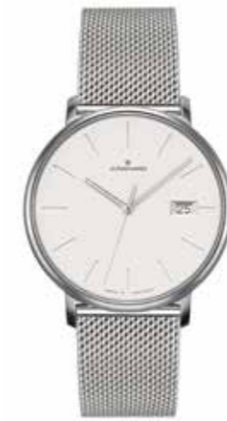
FORM Damen Quarzwirk, Edelstahl, 34,1 mm, Saphirglas, Milanaiseband € 429,-