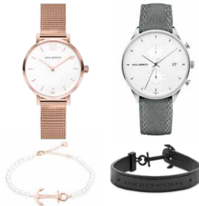
Paul Hewitt Sailor Line Modest Rose Damenuhr, 28 mm, € 129,- Chrono Line Herrenuhr, 42 mm, € 179,- Signum Lederarmband € 49,90 Anchor Spirit Pearl Damenarmband € 49,90