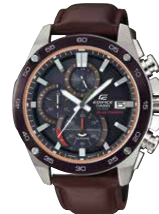
Edifice Solarbetrieb, Saphirglas, Echtleiderband mit Dornschnelle € 209,-