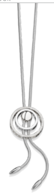
Evaine Finesse Roségold und Edelstahl mit Brillanten € 1.290,- Weißgold und Edelstahl mit Brillanten € 1.995,-