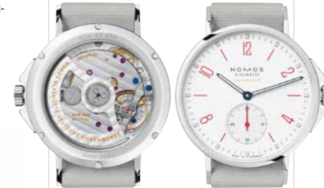
Ahoi neomatik signalweiß Kaliber DUW 3001, Edelstahl, 36,3 mm, Saphirglasboden, Stundenindizes mit Superluminova, Textilband € 3.240,-

Zeitmesser mit klarlinigem Design und in exzellenter „Made in Germany“- Qualität zeichnen die Kollektionen der 1990 gegründeten Manufaktur aus, die die Tradition deutscher Uhrma- cherkunst hochleben lässt.