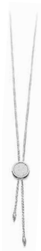
Miss Weißgold und Edelstahl mit Brillanten € 995,-