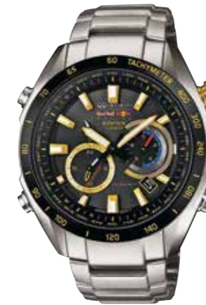
Edifice Massives Edelstahl, Weltzeit- Funktion, Funksignalempfang, wasserdicht bis 10 bar € 419,-

Casio ist nicht nur ein Pionier bei Digital-uhren, begeistert seit Jahrzehnten die Massen der Zeitmesser-Fans auch mit seinen absolut stoßfesten und stylischen G-Shock-Uhren, Funkuhren sowie hochwertigen Sport- und Freizeituhren. Ganz aktuell auch mit Smartwatches. Die Modelle aus den Serien Edifice, Pro Trek und G-Shock sind weltweit bekannt und beliebt.