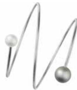
Humphrey Twister Armreifen € 650,- Ringe mit grauer Akoja-Perle ab € 200,-