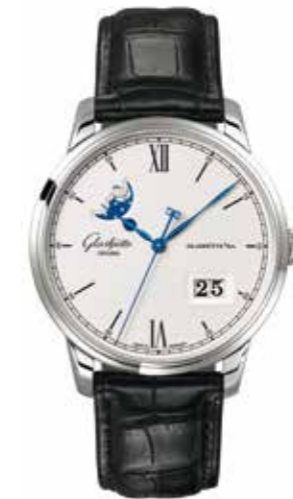
Senator Excellence Panoramadatum Mondphase Automatikwerk 36-04, Edelstahl, 40 mm, 100 Stunden Gangreserve, FS* € 10.600,-

Gerlinde König ist unsere Uhrenexpertin und mit Charme nahe an unseren Kunden. Durch ihr Engagement seit über 20 Jahren ist sie die Koryphäe der Horologie im Hause Hochholzer.