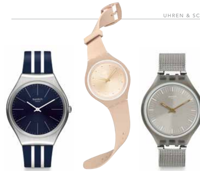
Swatch Skinblueiron € 135,- Skinskin € 105,- Skinmesh € 110,-