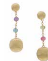
Africa Gemstone Ohrhänger und Armband aus Gelbgold mit handgemachten Gravuren und Edelsteinen ab € 1.000,-