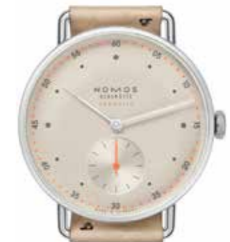
Metro neomatik champagner Kaliber DUW 3001, Edelstahl, 35 mm, Saphirglasboden, Band mit Schnell- wechsel-Federstegen € 3.120,-