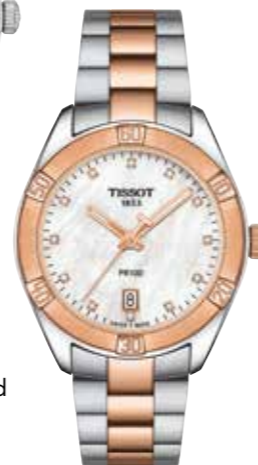
Tissot PR 100 Sport Chic Edelstahlgehäuse mit PVD-Beschichtung in Roségold, 36 mm € 385,-