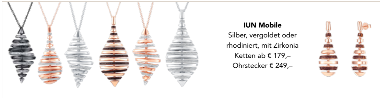
IUN Mobile Silber, vergoldet oder rhodiniert, mit Zirkonia Ketten ab € 179,- Ohrstecker € 249,-