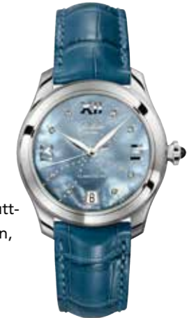
Lady Serenade Automatikwerk 39-22, Edelstahl, 36 mm, Perlmutterzifferblatt mit 8 Brillanten, Achat-Cabochoon besetzte Krone, DS* € 6.300,-