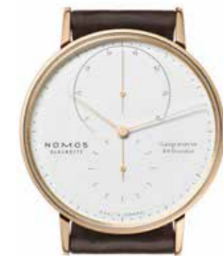
Lambda 39 Manufakturkaliber DUW 1001, Roségold, dreiteiliger Saphirglasboden, weiß versilbertes Zifferblatt, Lederband € 12.800,-