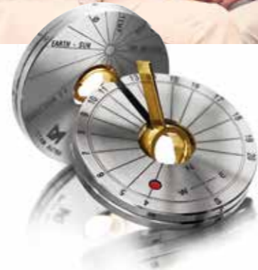
Anhänger Sonnenuhr Titan und Gelbgold € 1.125,-