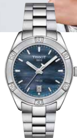
Tissot PR 100 Sport Chic Edelstahlgehäuse, 36 mm, Edelstahlband € 325,-