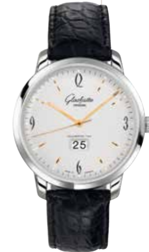
Sixties Panoramadatum Automatikwerk 39-47, Edelstahl, 42 mm, DS*, Saphirglasboden € 7.900,-