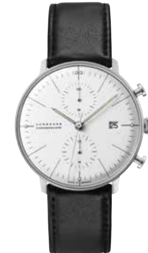
max bill Chronoscope Automatik, Chronoscope mit Stopsekunde, Edelstahl 40,0 mm, 4-fach verschraubter Boden, Kalbslederband € 1.645,-