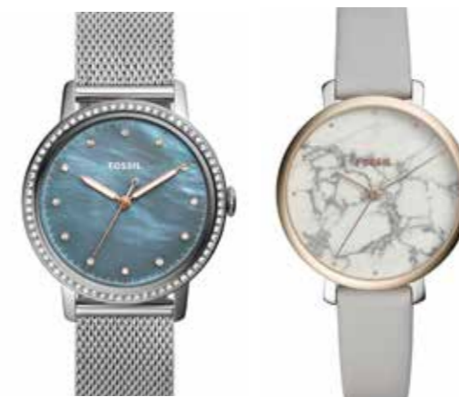
Fossil Damenuhr mit Perlmutterzifferblatt und Zirkonialünette, Milanaiseband € 149,- Damenuhr Bicolor mit Marmorzifferblatt, Lederband € 129,- Collier in Rosé mit Rosenquarz und Zirkonia € 59,- Armband € 49,-