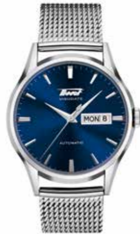
Tissot Heritage Visodate Automatic Edelstahlgehäuse, 40 mm, Edelstahlband € 570,-