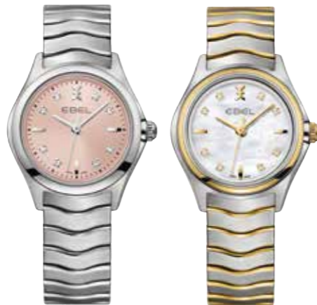
Ebel Wave Lady Quarzwirk, 30 mm, Zifferblatt mit acht Diamantindizes (0,052 ct), wasserdicht bis 5 bar links € 1.850,-, rechts € 2.250,-