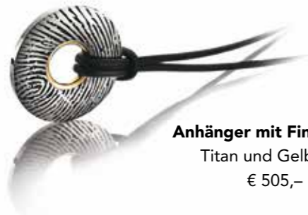
Anhänger mit Fingerprint Titan und Gelbgold € 505,-

Maskuline, stilvolle Accessoires mit hochwertigen Materialien wie Titan, Carbon und Meteoritglas in Kombination mit verschiedenen Goldsorten sind die Spezialität des Herrenschmucks von Meister.