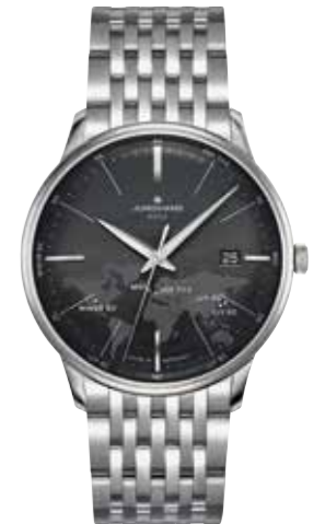
Meister MEGA Multifrequenz-Funkwerk J101.65, ITC (Intelligent Time Correction), 38,4 mm, Saphirglas, Datums- anzeige mit Ewigem Kalender, 5-fach verschraubter Sichtboden € 1.190,-