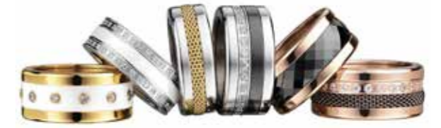
Arctic Symphony individuell kombinierbare Ringe (Stahl, Swarovski-Steine, Keramik) ab € 59,-