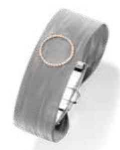
Evaine Edelstahl und Roségold mit Brillanten € 890,-