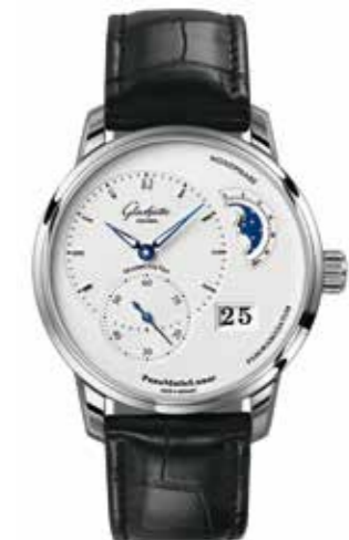
PanoMaticLunar Automatikwerk 90-02, Edelstahl, 40 mm, FS* € 9.800,-