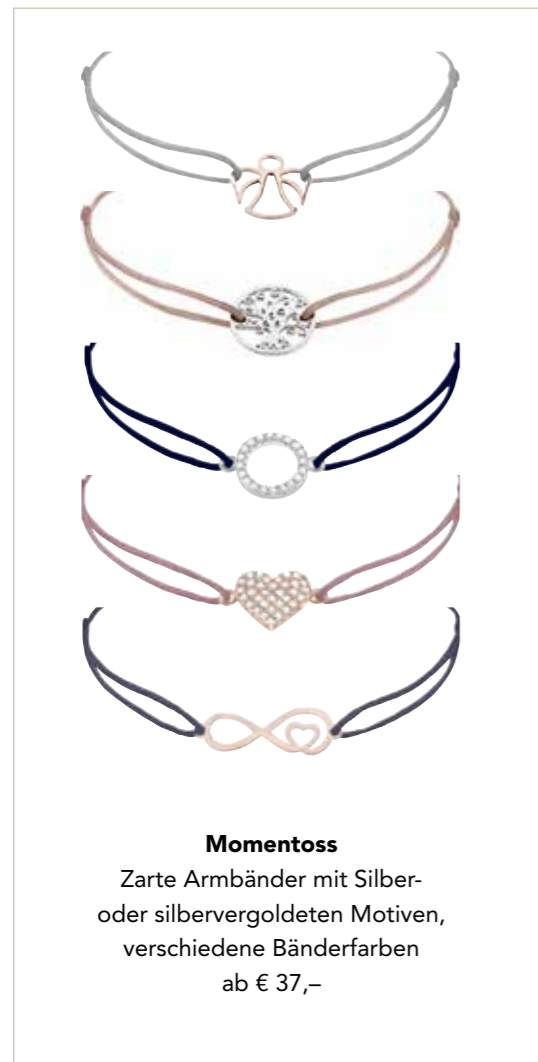
Momentoss Zarte Armبänder mit Silber- oder silbervergoldeten Motiven, verschiedene Bänderfarben ab € 37,-