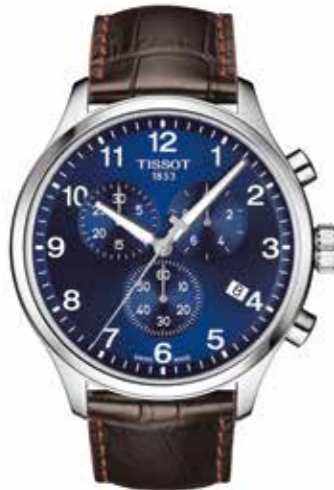
Tissot Chrono XL Edelstahlgehäuse, 45 mm, Lederband € 330,-