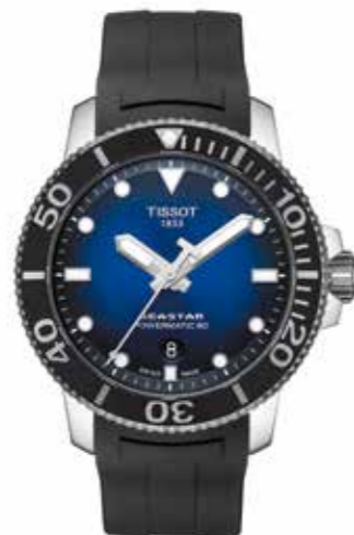
Tissot Seastar 1000 Powermatic 80 Edelstahlgehäuse, 43 mm, wasser- dicht bis 30 bar, Kautschukband € 690,-