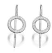
Evaine Finesse Weißgold mit Brillanten € 995,-