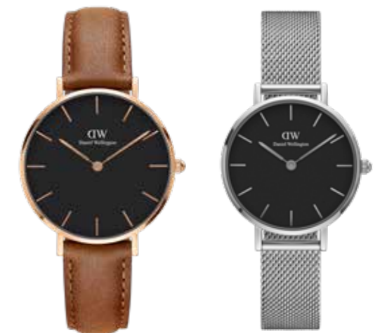
Daniel Wellington Uhren mit verschiedenen Durchmessern, Farben und Bändern ab € 119,-