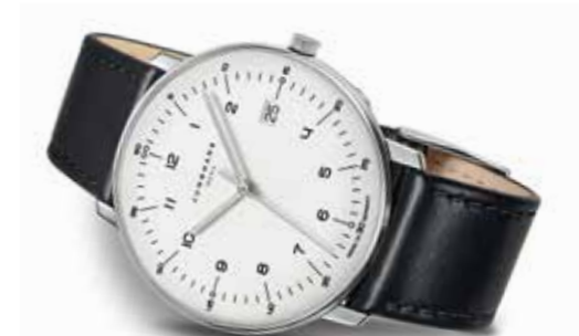
max bill MEGA Multifrequenz-Funkwerk J101.65, ITC (Intelligent Time Correction), 38 mm, Datumsanzeige mit Ewigem Kalender, 4-fach verschraubter Boden € 795,-