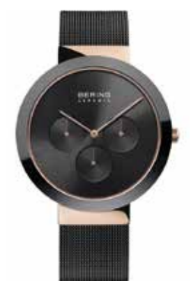
Ceramic Quarzwerk, Stahl, Keramik- lunette, Milanaisband € 189,-