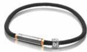
Men's Collection Carbon, Titan, Roségold € 175,-