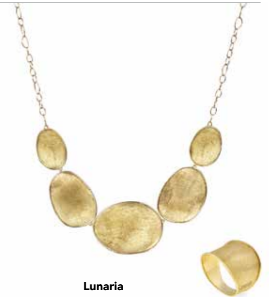
Lunaria Schmuckset aus Gelbgold mit handgemachten Gravuren ab € 600,-