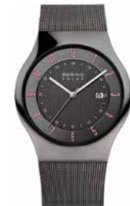
Slim Solar Collection grauer Edelstahl € 199,-