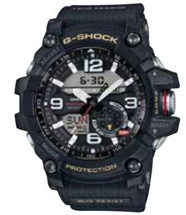
G-Shock Mudmaster Schmutzresistent, Mineralglas, wasserdicht bis 20 bar € 299,-