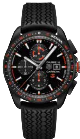
TAG Heuer Carrera Calibre 16 Special Edition Senna Automatik-Chrono- graph, 44 mm, wasser- dicht bis 100 m € 4.150,-