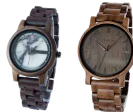
Holz Kern Denali Walnuss mit Marmorzifferblatt € 169,- Frühlingsabend Walnuss mit Föhrenzifferblatt € 129,-