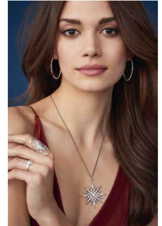
Thomas Sabo Kingdom of Dreams Silber mit Zirkonia Stern-Anhänger € 298,- Kleiner Ring € 79,- Großer Ring € 129,- Creolen € 149,-