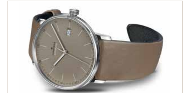
FORM A Automatik, Edelstahl, 39,3 mm, Saphirglas, 4-fach verschraubter Sichtboden, Kalbslederband € 840,-

1861 wurde die Uhrenfabrik Junghans in Schramberg im Schwarzwald gegründet. Seither werden hier die Uhren mit dem Stern mit hohen Designansprüchen, Detailverliebtheit sowie uhrmacherischer und technologischer Kompetenz gefertigt.