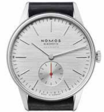
Orion neomatik 39 silvercut Kaliber DUW 3001 38,5 mm, Edelstahl, dreiteilig gewölbter Saphirglasboden, Zifferblatt mit Horizontalschliff und geprägten Indizes, Lederband € 3.060,-