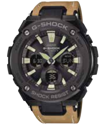
G-Shock G-Steel Edelstahl-Resin-Gehäuse, Weltzeit-Funktion, Solarbe- trieb, wasserdicht bis 20 bar € 299,-