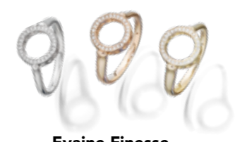
Evaine Finesse Rot-, Gelb- oder Weißgold mit Brillanten € 945,-