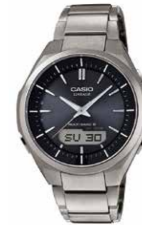
Funk- und Solaruhr Titan, 5 Tagesalarme, Stopp- funktion, Saphirglas, Welt- zeit-Funktion, Solarbetrieb € 399,-