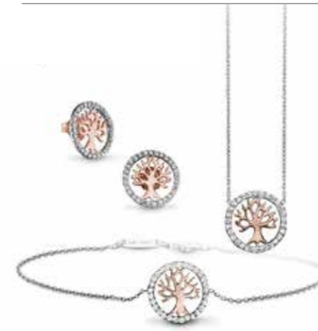
Julie Julsen Petite Silber und rosévergoldet mit Zirkonia Ohrstecker € 79,- Collier € 79,- Armband € 69,-