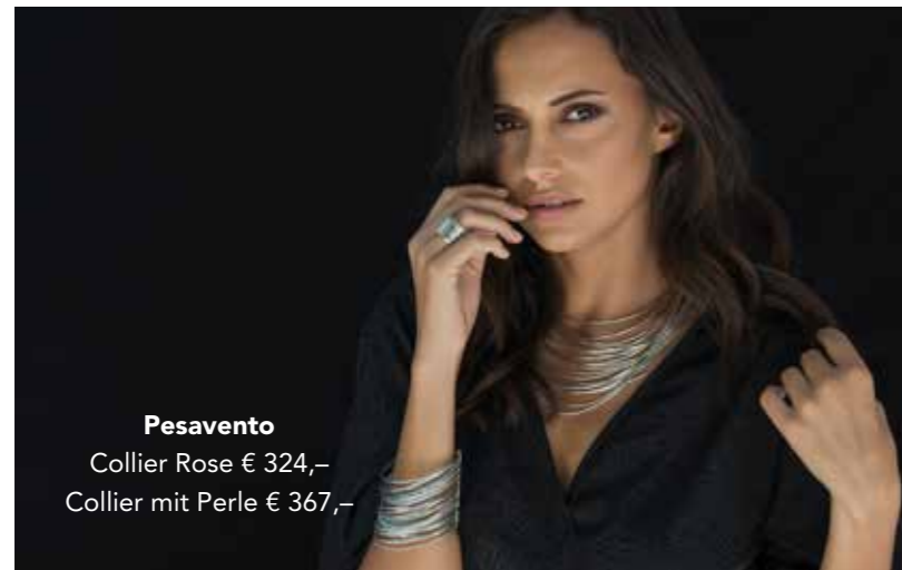
Pesavento Collier Rose € 324,- Collier mit Perle € 367,-