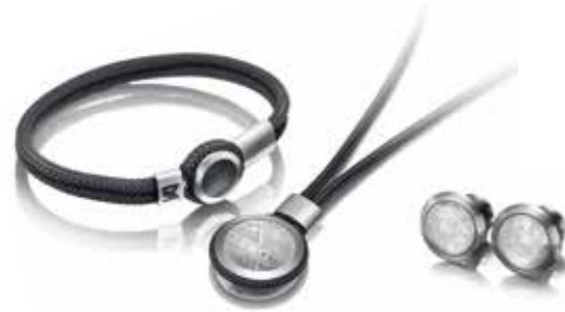
Men's Collection Armband aus Carbon und Titan € 535,- Anhänger aus Carbon, Titan, Meteorit, Mineralglas € 605,- Manschettenknöpfe aus Titan, Meteorit, Mineralglas € 560,-