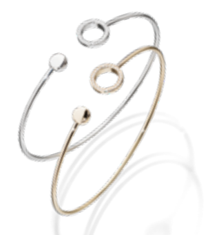
Evaine Finesse Embracelet Gelb- oder Weißgold mit Brillanten € 1.495,-