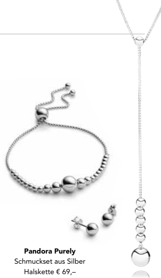
Pandora Purely Schmuckset aus Silber Halskette € 69,- Armband € 59,- Ohrstecker € 39,-