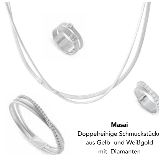
Masai Doppelreihige Schmuckstücke aus Gelb- und Weißgold mit Diamanten ab € 1.600,-

„Made in Italy“: Dank der Tradition, die tief mit der Geschichte des italienischen Schmucks verbunden ist, prägt Marco Bicego einen einzigartigen und unverwechselbaren Stil. Die bekannten Ikonen entstehen in sorgfältiger Handarbeit.