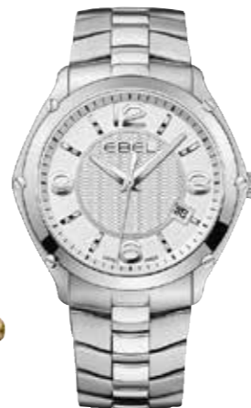
Ebel Sport Gent Quarzwirk, 40 mm, wasserdicht bis 5 bar € 1.850,-