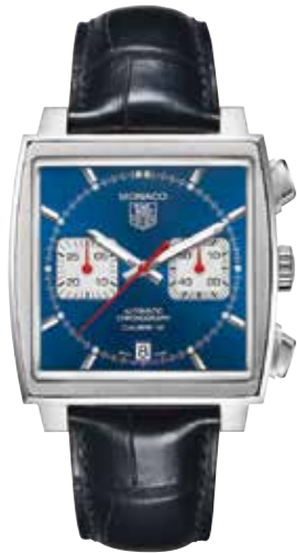
TAG Heuer Monaco Calibre 12 Automatik-Chronograph, 39 x 39 mm, wasserdicht bis 100 m € 4.900,-