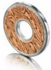
Anhänger mit versteinertem Holz Titan und Roségold € 530,-