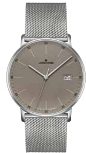
FORM Quarz Quarzwirk, Edelstahl, 39,3 mm, Saphirglas, 4-fach verschraubter Boden, Milanaiseband € 429,-