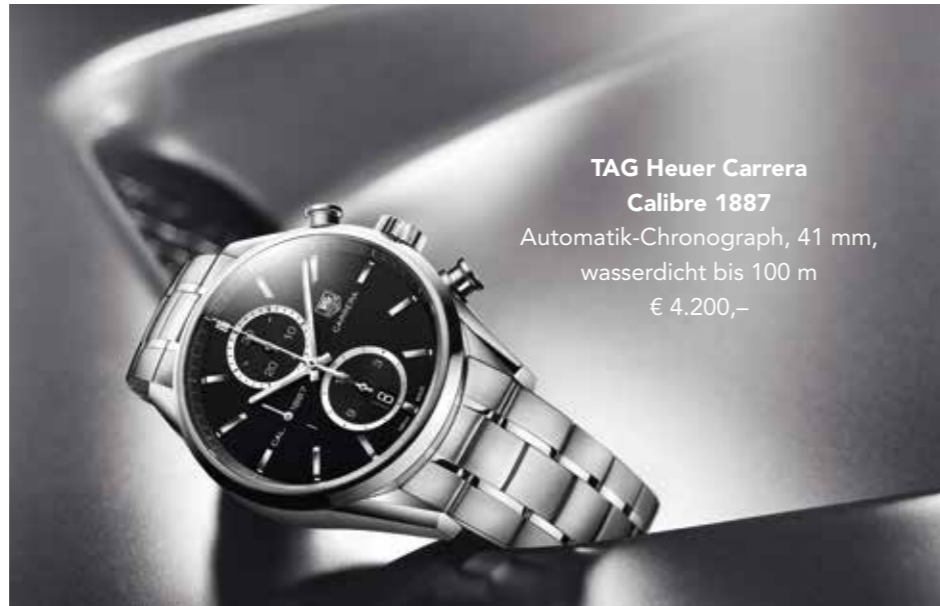
TAG Heuer Carrera Calibre 1887 Automatik-Chronograph, 41 mm, wasserdicht bis 100 m € 4.200,-