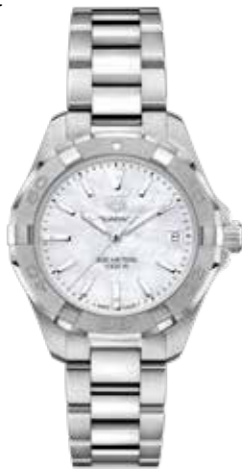
TAG Heuer Aquaracer 300M Lady Quarzwirk, 32 mm, wasserdicht bis 30 bar € 1.300,-