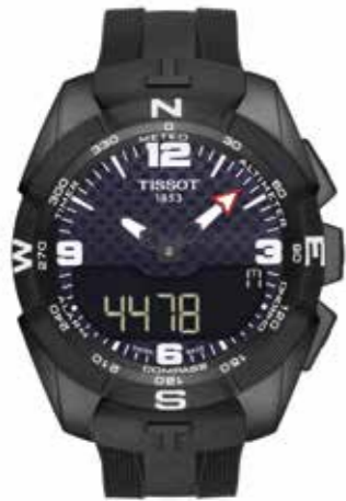
Tissot T-Touch Expert Solar antimagnetisches, PVD-beschichtetes Titangehäuse, 45 mm € 995,-

Die Marke, deren Headquarter in Le Locle im Schweizer Jura-gebirge steht, bleibt ihrem Leitspruch „Innovators by Tradition“ treu. Fortschrittliche Funktionalität, ausgefeiltes Design und zuverlässige Qualität bestimmen das Profil Tissots.