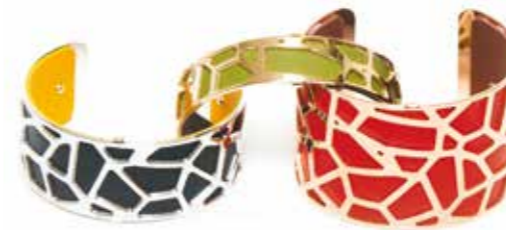
Les Georgettes Armspangen in verschiedenen Ausführungen, Breiten und Farben, individuell gestaltbar durch diverse Ledereinlagen ab € 69,-