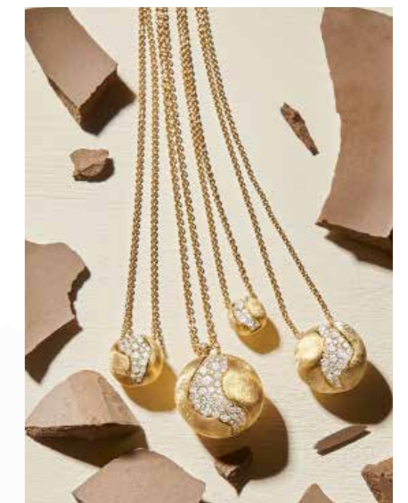
Africa Constellation Kugeln aus Gelbgold mit Diamantpavé ab € 1.700,-