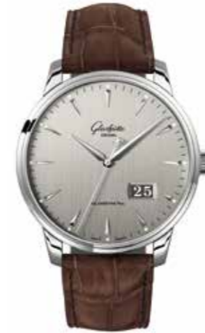
Senator Excellence Panoramadatum Automatikwerk 36-03, Edelstahl, 42 mm, FS*, 100 Stunden Gangreserve € 9.600,-