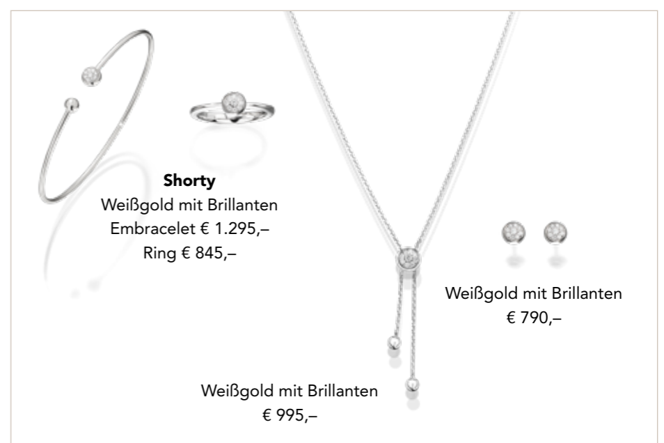
Shorty Weißgold mit Brillanten Embracelet € 1.295,- Ring € 845,-