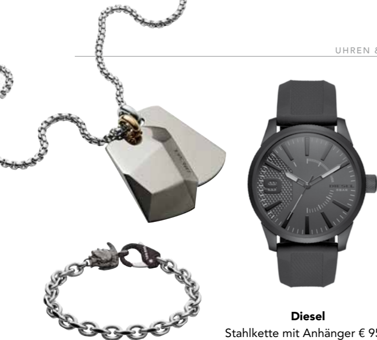
Diesel Stahlkette mit Anhänger € 95,- Gliederarmband aus Stahl € 75,- Herrenuhr aus Stahl mit Kautschukband € 179,-