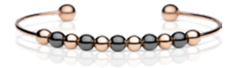
Arctic Glow Edelstahl, Keramik € 69,90